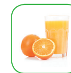
Jus de fruit

Suivez toujours les recommandations de votre médecin.