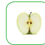
Pomme pelée et crue

Suivez toujours les recommandations de votre médecin.