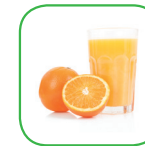
Jus de fruit

Suivez toujours les recommandations de votre médecin.