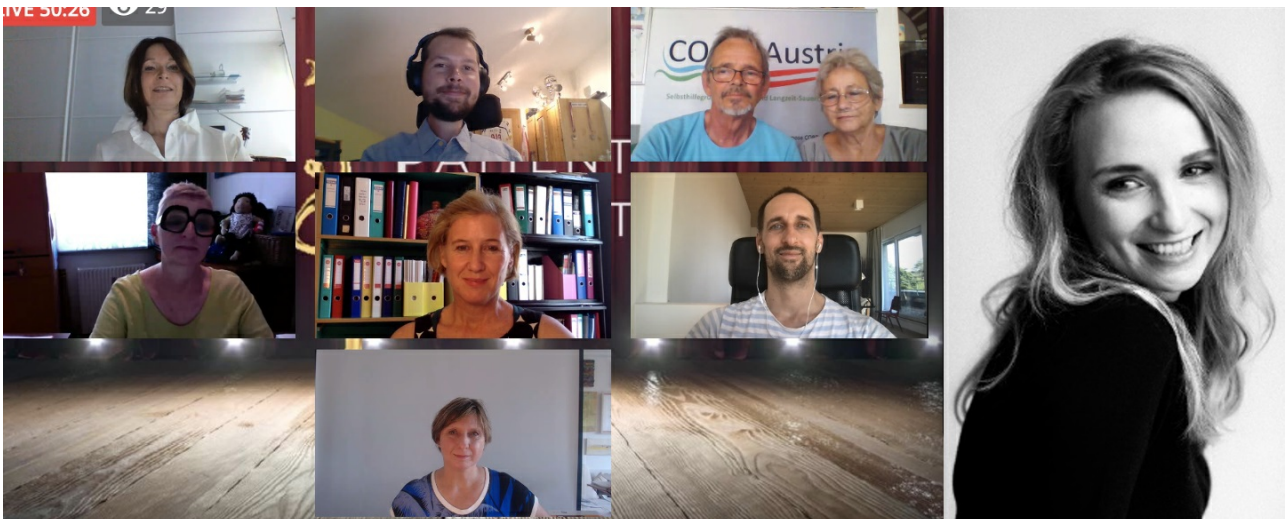
Die Gewinnerinnen und Gewinner des PIA - Patient Innovation Award 2021 bei der virtuellen Preisverleihung